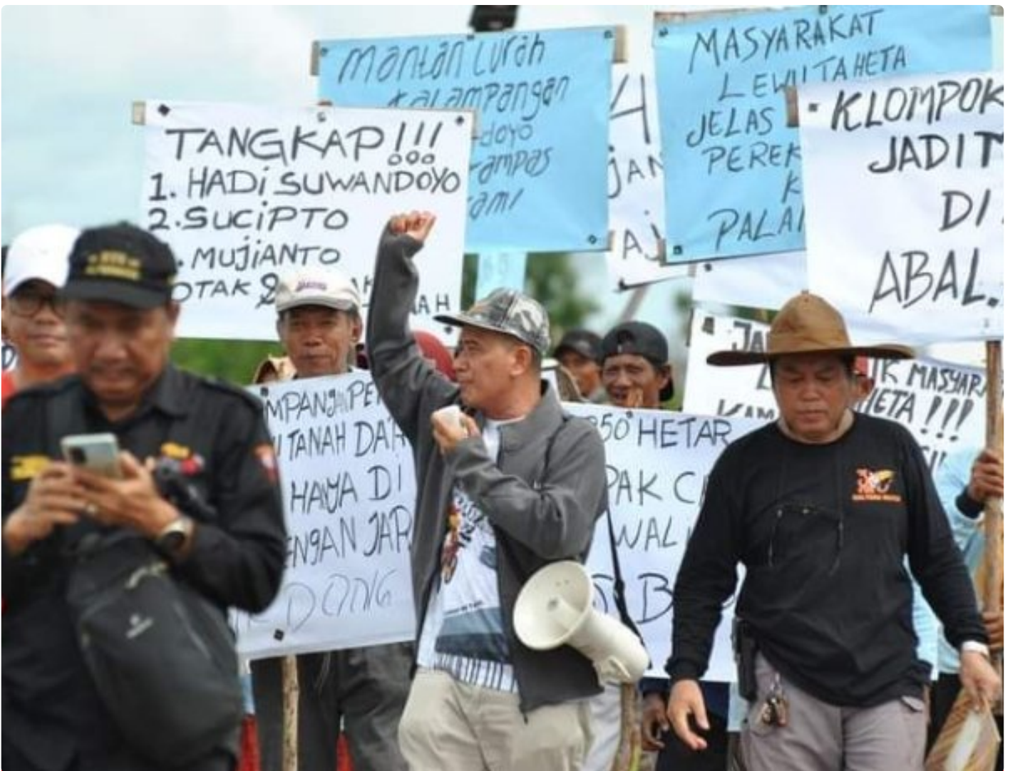
Gambar: Aksi Unjuk Rasa Masyarakat Kelompok Tani "Lewu Taheta"

PALANGKA RAYA - Sengketa kepemilikan tanah yang terjadi di Kota Palangka Raya selama ini, cukup meresahkan. Hal ini tentunya bisa mempengaruhi geliat pembangunan di ibukota provinsi Kalimantan Tengah (Kalteng) kedepannya.