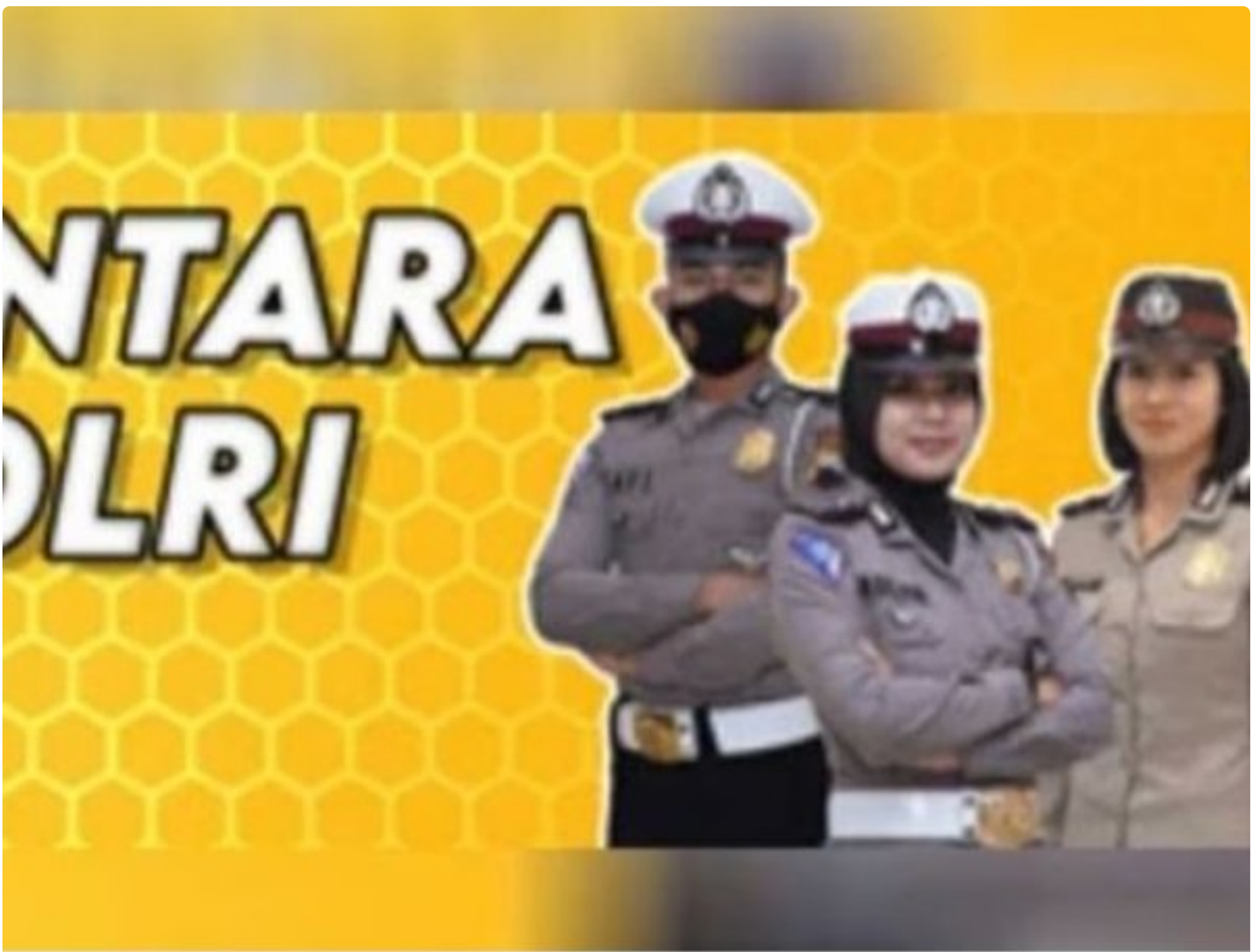
Penerimaan Polri Bakomsus

PALANGKA RAYA - Kesempatan terbuka bagi lulusan bidang pertanian, perikanan, peternakan, gizi, dan kesehatan masyarakat untuk bergabung menjadi anggota Polri melalui program penerimaan Bintara Kompetensi Khusus (Bakomsus).